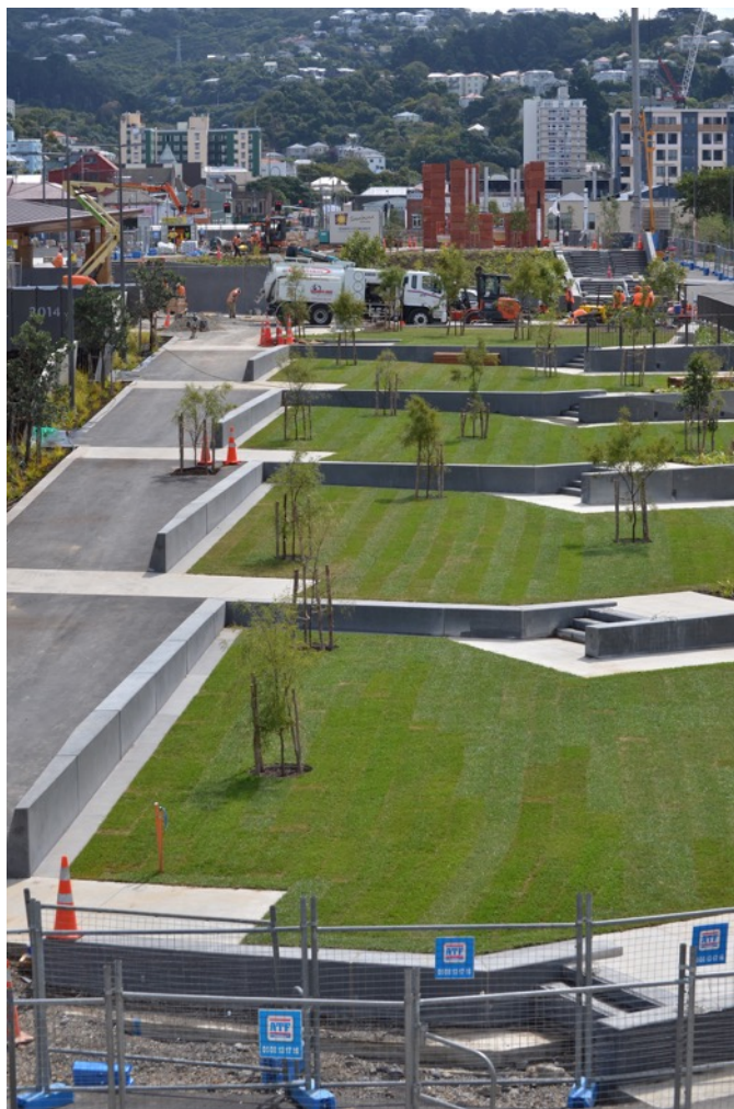
5. Vue des terrasses en cours d'aménagement en février 2015.

forme s'articule autour d'un espace engazonné accessible par un escalier et une rampe. Des murets en béton définissent le mouvement de circulation et permettront d'accueillir les futurs monuments. Même si le parc se veut ouvert sur la ville, deux pavillons symbolisent les entrées principales du site, localisées à l'extrémité de Tory Street et de Taranaki Street, deux rues parallèles venant du centre de Wellington.