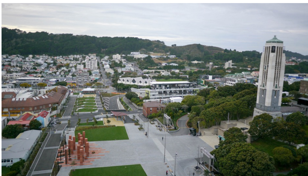
6. Vue aérienne de la place centrale, prise le 22 avril 2015, unifiant le Monument commémoratif de guerre au nouveau parc (Photographie the Memorial Park Alliance, Licence sous CC BY-ND 4.0).

Le plus important travail d'aménagement est la réalisation de la place centrale devant le campanile. En effet, pour assurer la cohérence entre l'ancien site de mémoire et le nouveau parc, les architectes souhaitaient faire disparaître la route nationale sous terre. Ce gain de place rendait la zone en surface quasiment piétonnière et faisait de Pukeahu un seul et même lieu de souvenir (cf. Photo 6).