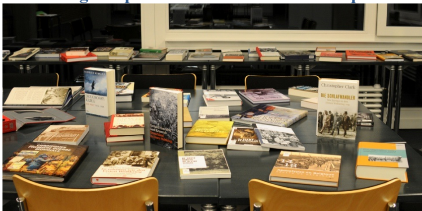
Figure 2 : Exposition des nouvelles acquisitions sur la Première Guerre mondiale à l'occasion de la nuit des musées 2014