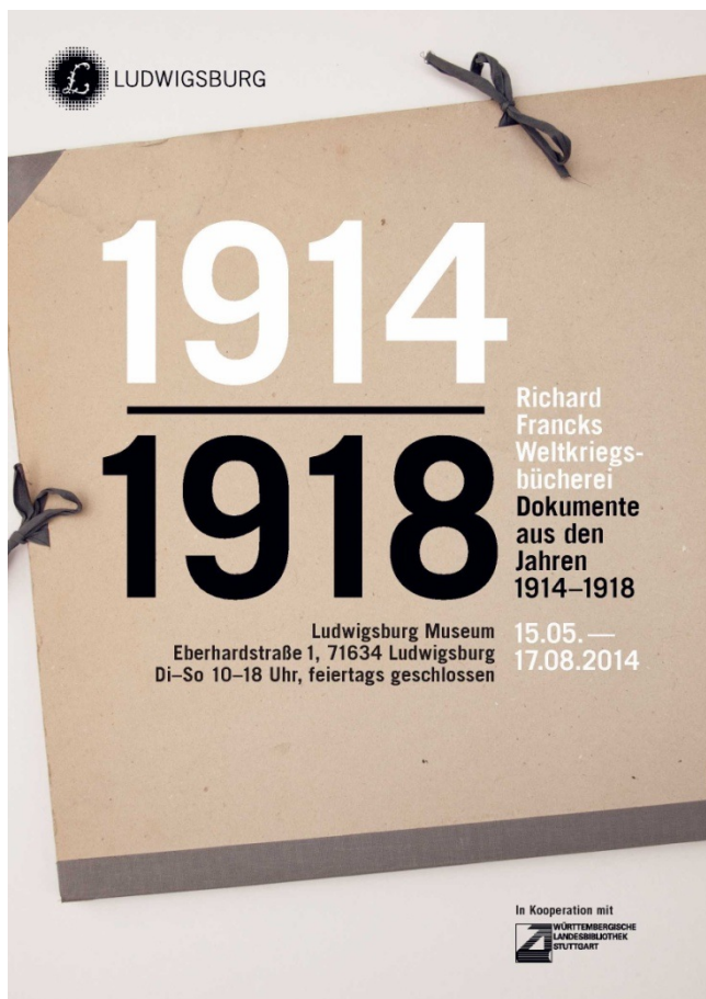
Figure 1: Exposition sur la bibliothèque de Richard Franck sur la Première Guerre mondiale au musée de Ludwigsburg

Par Christian Westerhoff, Directeur de la Bibliothek für Zeitgeschichte (Stuttgart)