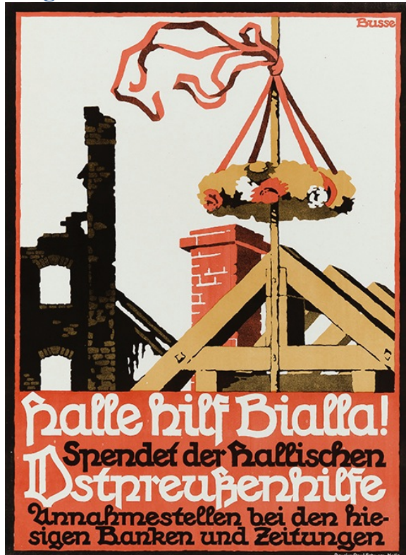
Figure 4: « Halle aide Bialla »: affiche acquise en 2013, visible en ligne sur le portail thématique Première Guerre mondiale

Afin de faciliter l'accès à ses diverses collections, la BfZ a numérisé une partie de ses fonds sur la Première Guerre mondiale. On peut voir ces documents sur le « portail thématique Première Guerre mondiale », qui propose non seulement près de 400 livres et brochures, mais également 1.600 affiches, plus de 1.500 journaux de guerre, près de 5.000 tickets de rationnement, ainsi que des carnets, lettres et tracts. Une sélection a été intégrée dans le système d'information sur le Bade-Wurtemberg, LEO-BW 11 . D'autre part, le portail et son contenu sont largement référencés ou indiqués par des liens 12 .