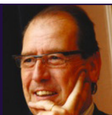
MAÎTRE CHRISTIAN CHARRIÈRE-BOURNAZEL, avocat

Christian Charrière-Bournazel est un avocat français, né le 2 juin 1946 à Limoges. Il est bâtonnier de l'Ordre des avocats du barreau de Paris, de 2008 à 2010, puis il est président du Conseil national des barreaux de 2012 à 2014.