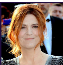
AGNÈS JAOUÏ, marraine de l'édition 2021

Agnès Jaoui, comédienne française, a été dirigée par de grands réalisateurs (Patrice Chéreau, Philippe Muyl, Cédric Klapisch, Alain Resnais (grâce auquel elle obtiendra le César de la Meilleure Actrice dans un second rôle en 1998), Christophe Blanc, et plus récemment Carine Tardieu, Bruno Podalydès et Blandine Lenoir.