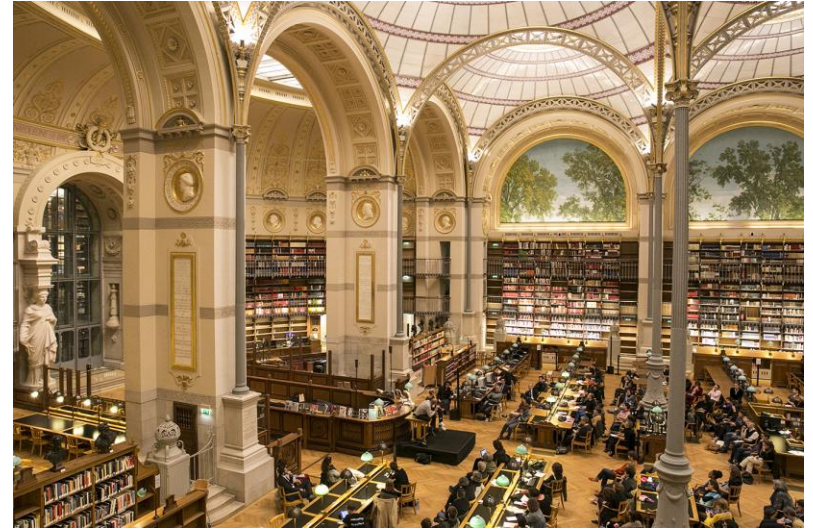
Bibliothèque de l'Institut national d'histoire de l'art (INHA)