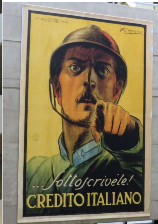
vue du hall de la bibliothèque, octobre 2014