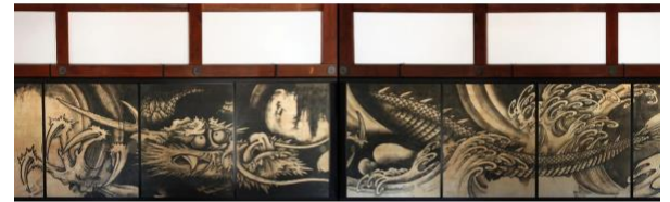
MASTER HISTOIRE DE L'ART

UNIVERSITÉ PARIS 1 – PANTHÉON-SORBONNE Ecole d'histoire de l'art et d'archéologie de la Sorbonne (UFR 03)