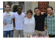
finale du tournoi d'échecs