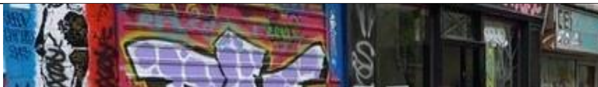
TABLE RONDE HORS DES SENTIERS BATTUS ? ACTEURS, PRODUITS, PUBLICS